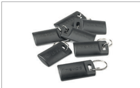
TimeMoto RF-110 lot de 25 porte-clés RFID Article : 125-0604