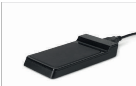
TimeMoto RF-150 Lecteur RFID USB Article : 125-0605