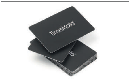
TimeMoto RF-100 lot de 25 badges RFID Article : 125-0603