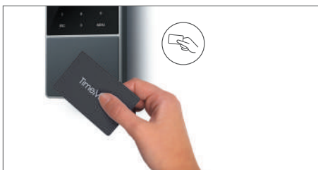
Pointage avec carte de proximité RFID ou code PIN