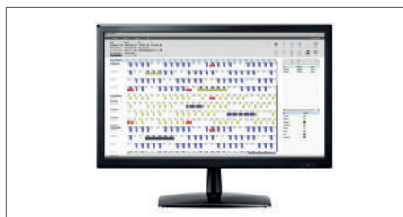
Logiciel TimeMoto pour un seul PC inclus