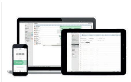
TimeMoto Cloud / TimeMoto Cloud Plus Article : 139-0612 / 139-0613