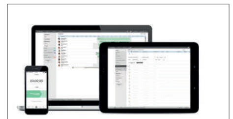
Ou TimeMoto Cloud (30 jours inclus)