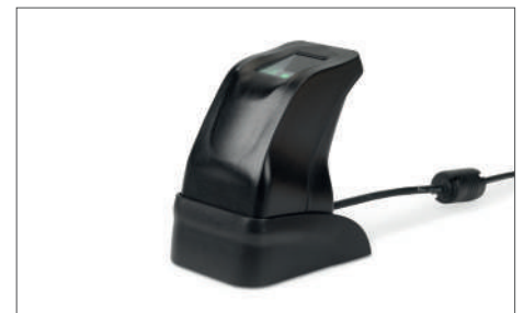
TimeMoto FP-150 Lecteur empreintes digitales USB Article : 125-0606