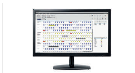
Logiciel TimeMoto pour un seul PC inclus