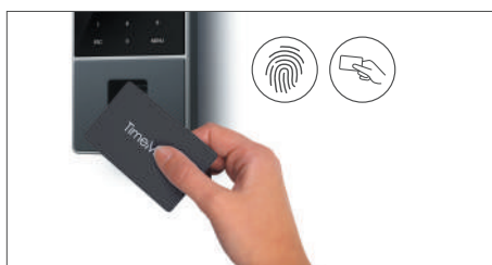
Pointage avec carte de proximité RFID, empreintes digitales ou code PIN